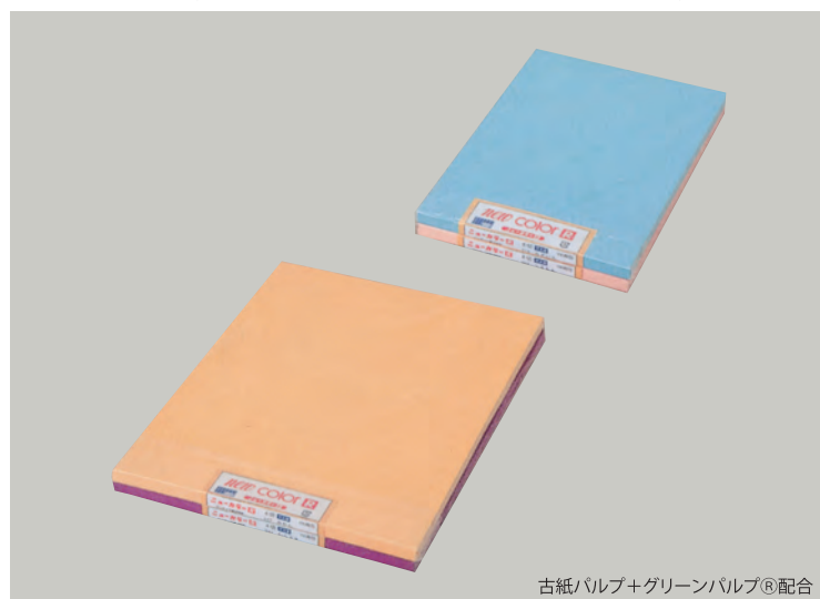
古紙パルプ+グリーンパルプ®配合