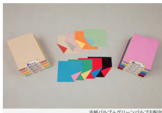
古紙パルプ+グリーンパルプ®配合